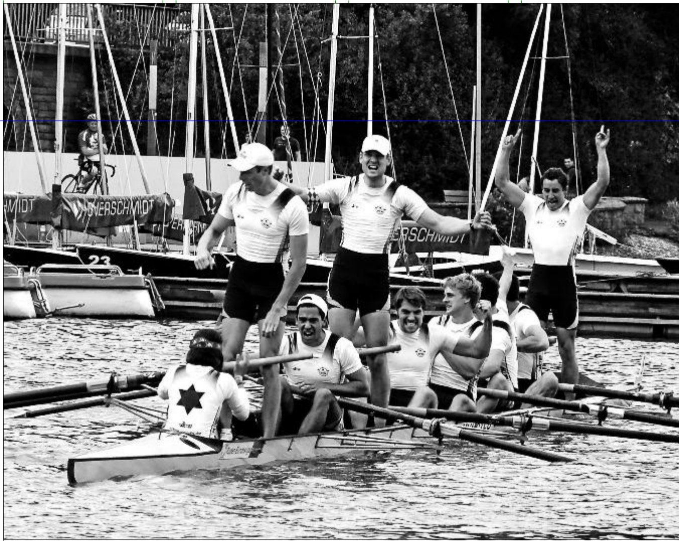
Beim Heimrennen auf dem Aasee siegte der Münster-Achter knapp vor dem Titelverteidiger aus Krefeld. Bei der Riemen-Schlacht in Hannover wollen die Athleten das Gelbe Trikot am Samstag verteidigen.